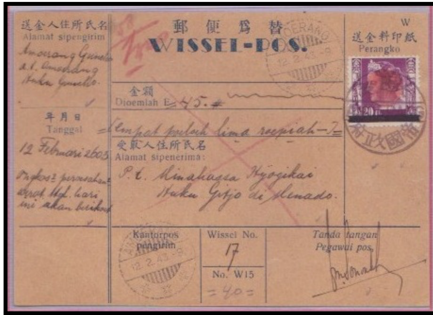
Prangko cetak tindih Hinomaru

Diatas prangko Wilhelmina digunakan untuk berkirim Wessel dari Amoenang ke Menado tahun 1943. Setelah Tahun 1943 kebijakan pun bertambah dengan menambahkan cetak tindih Jangkar dan Dai Ni Hon yang sama dengan tipe Sulawesi Selatan, kebijakan ini berlangsung sampai akhir kekuasaan Jepang pada tahun 1945 dan terakhir terlihat di Gorontalo pada tahun 1946 dimana NICA telah menguasai kawasan Sulawesi Utara